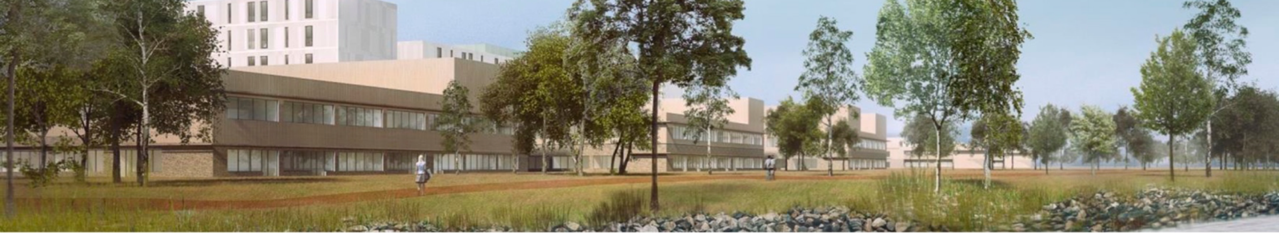
Illustrasjon: CURA gruppen