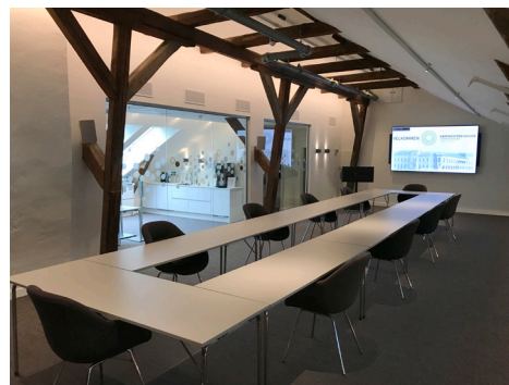
MØTEBORD | maks 10 personer

Det er hyggelig å kunne møtes fysisk - og vi er glade for å kunne tilby muligheten hos oss!