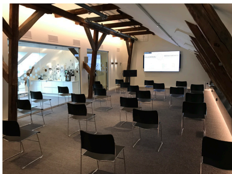
KINO | maks 25 personer

Vi kan tilby følgende oppsett i vårt største konferanserom «Engasjert» - med avstandsregel 1 meter fra skulder til skulder: